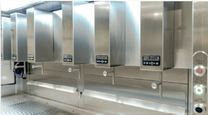
ABARCON Chemikalien Dosiereinheit ACD

Versorgungssysteme für sicheres Handling am Arbeitsplatz