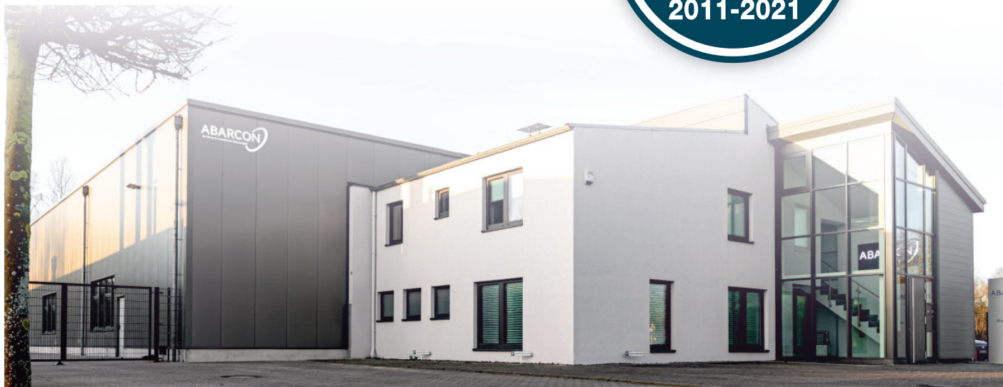
unser Standort in Rastede