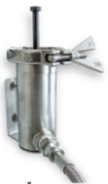
Rohrsammler für HPLC-Kapillare