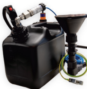
AEU 7 Kanister aus PE HD el. nicht medienberührte Füllstandmessung über Drucksensor