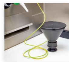
Trichter im Abzug