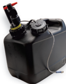
AEU 8 Kanister aus PE HD el. Füllstandmessung über Schwimmerschalter